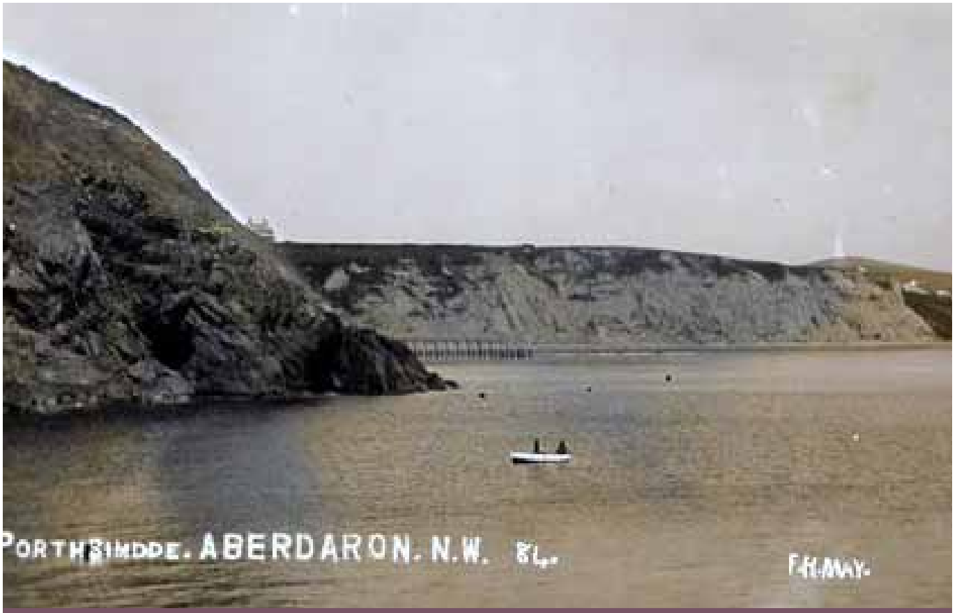
Glanfa Porth Simdde