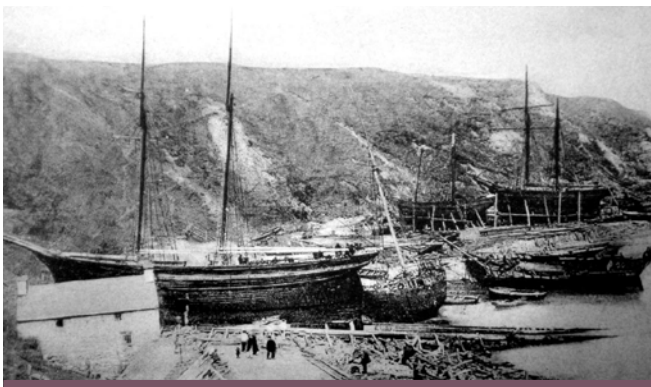
Y llongau olaf i'w hadeiladu yn Nefyn

Rhwng 1760 a 1889 cafodd 123 o longau eu hadeiladu yn Nefyn a 57 ym Mhorthdinllaen, ond ychydig yn unig cyn canol yr 18fedG. Y cyfnodau prysuraf oedd rhwng 1840 tan 1870. Stŵps a sgwners oedd y rhan fwyaf o longau Nefyn a Phorthdinllaen a chaent eu hystyried yn hynod o gryf. O'r 137 o longau gafodd eu hadeiladu yma bu bron eu hanner yn hwylio am 30 mlynedd ac 19