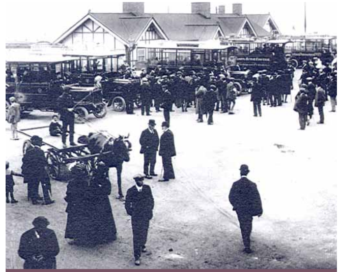
Pen Cob, Pwllheli yng nghyfnod y trên a'r bws

Cyn i'r ffordd dyrpeg o Borthdinllaen i Foduan a'r ffordd sy'n fforchio i Bwllheli ac i gyfeiriad Porthmadog gael eu hadeiladu yn nechrau'r 19egG roedd teithio ar y tir yn orchwyl anodd iawn. Cafodd y ffordd dyrpeg o Lanbedrog i Bwllheli ei hadeiladu yn 1824.