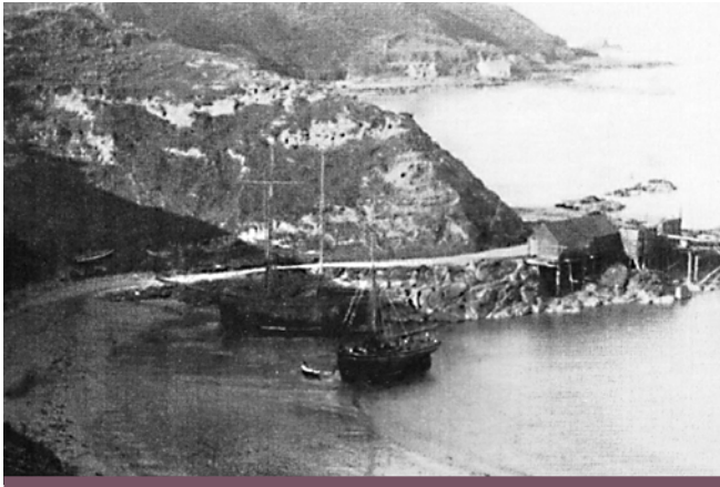
Pen Cim a Warws Dora

Daw'r ffordd i lawr o Forfa Nefyn i'r traeth yn y Bwlch (Bwlch Brudyn) (SH 28224084). Yma roedd dwy stêj i ddadlwytho llongau ac wrth droed y ffordd roedd o'dyn galch a iard lo. Roedd glanfa arall ar gyfer llwytho brics o'r gwaith ar ben yr allt ger Penrhos (lle mae maes parcio'r Ymddiriedolaeth Genedlaethol) rhwng 1868 a diwedd 1906. Wedi tynnu'r simne uchel cafodd y rwbel ei ddefnyddio fel sylfaen i'r ffordd sy'n arwain i'r Clwb Golff.