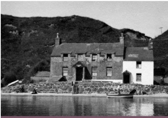
Tŷ Coch a Thŷ Coch Bach, drws nesaf

Enw tafarn Tŷ Coch yn wreiddiol oedd Plas y Borth ac ef yw'r prif atyniad twristaidd ym Mhorthdinllaen. Cafodd yr adeilad presennol ei godi â brics cochion – sy'n egluro'i enw. Daeth Capten Thomas Owen, postfeistr o Waterford, â hwy yma fel balast o'r Iseldiroedd yn 1823. Roedd wedi cymryd prydles 99 mlynedd am 10/- y flwyddyn ar ran o'r traeth yn 1771. Bu yno adeilad cynharach am fod olion ffenestri yn y seler a lle tân. Thomas Owen hefyd adeiladodd Dŷ Coch Bach.