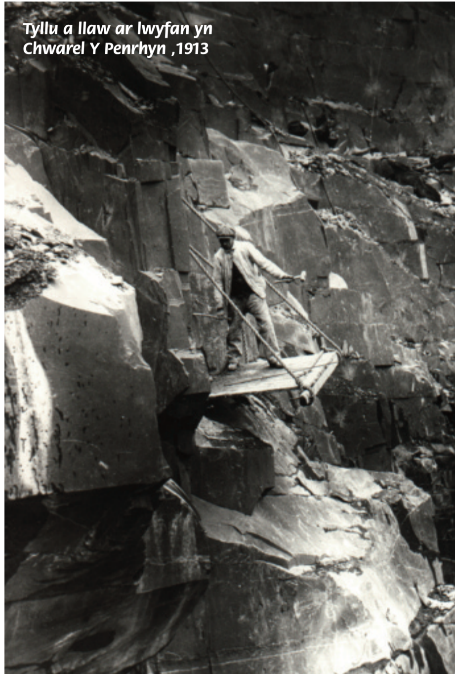
Tyllu a llaw ar lwyfan yn Chwarel Y Penrhyn, 1913

Roedd y chwarelwyr yn dioddef o afiechydon resbiradol cronig. Ymddengys bod gwneuthurwyr llechi wedi dioddef mwy na'r rhai oedd yn gweithio mewn rhannau eraill o'r chwarel. Er nad oedd y gwaith cyn galeted yn gorfforol â gwaith y creigwyr, roedd llwch y llechi yn waeth yma nag yn unman arall, ac ar gyfartaledd, roedd y