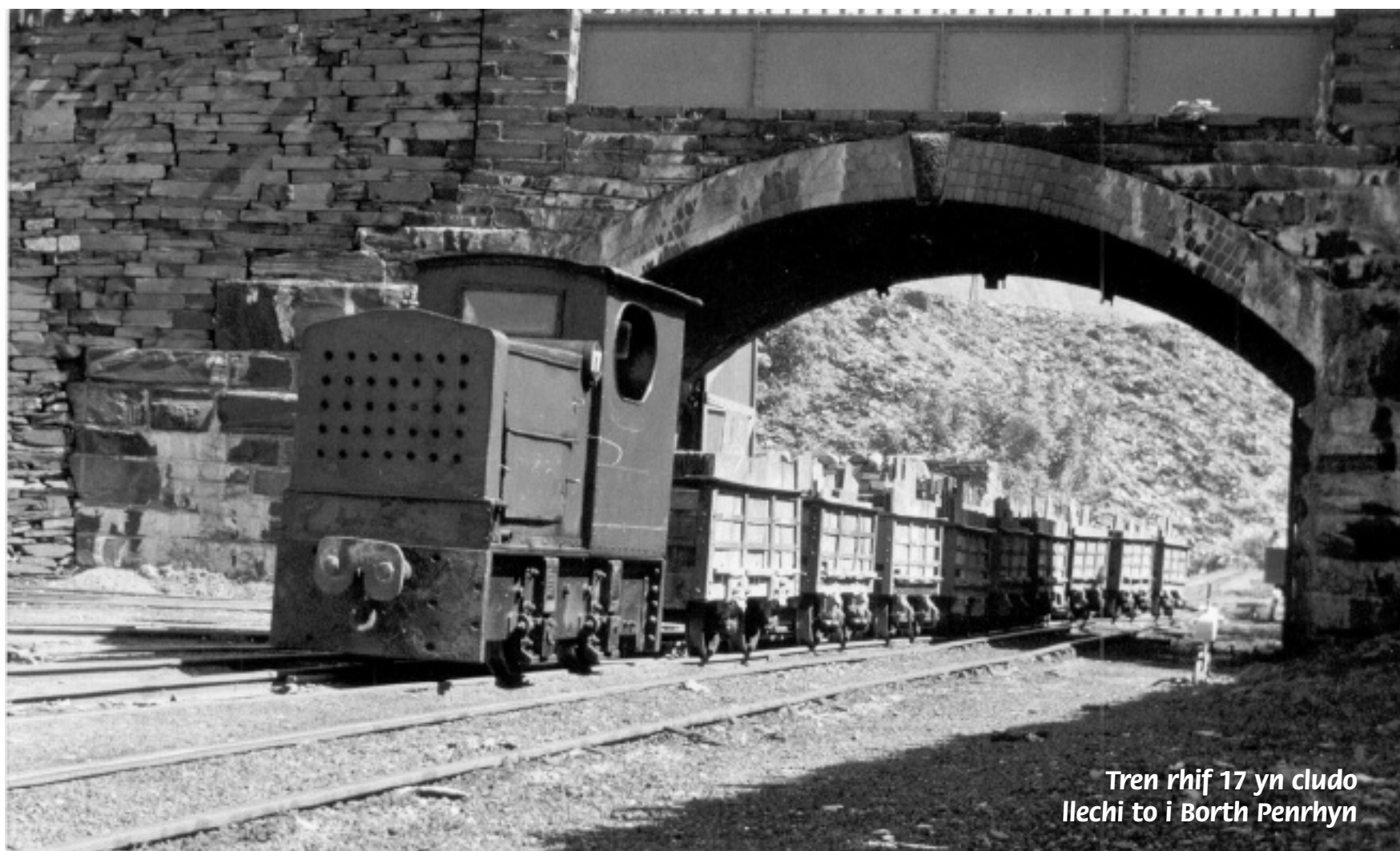
Tren rhif 17 yn cludo llechi to i Borth Penrhyn

Ym 1852, cysylltwyd Porth Penrhyn i lein y brif reilffordd. Roedd cangen milltir a hanner o hyd yn rhedeg i lawr i'r porthladd o'r lein a redai o Gaer i Gaergybi. Roedd llechi'r chwarel yn parhau i gyrraedd y porthladdoedd ar y tramffordd, ond o hynny ymlaen, gellid ei llwytho ar wagenni trenau yn hytrach na llongau.